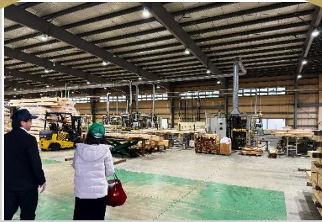
11月26日、君津の工場にて